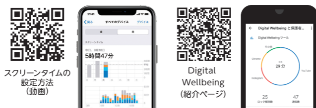
スクリーンタイムの設定方法(動画)

デジタルウェルビーイング Digital Wellbeing (Android10以上)