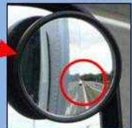
補助ミラーでは真後ろの 緊急車両を確認できる。