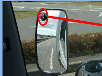
じどうにりんしゃ サイドミラーでは自動二輪車 を確認できない。