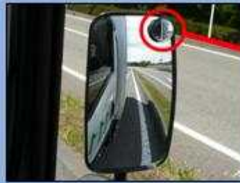
サイドミラーでは緊急車両 を確認できない。