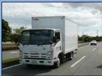
まうし きんきゆうしやりよう せつきんちゆう 真後ろから緊急車両が接近中