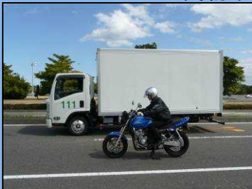
しかく サイドミラーの死角にいる 自動二輪車