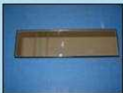
ワイドミラーの例