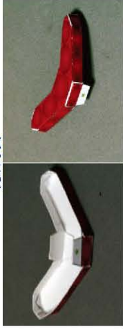
赤色灯の完成写真