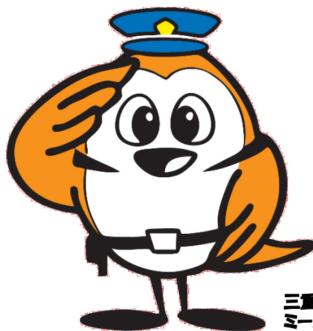
三重県警シンボルマスコット ミーポくん